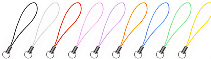
黒 白 レッド ピンク パープル オレンジ ブルー グリーン イエロー