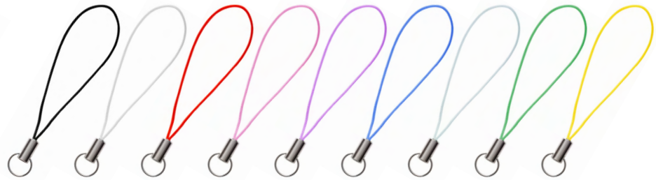
黒 白 レッド ピンク パープル ブルー ライトブルー グリーン イエロー