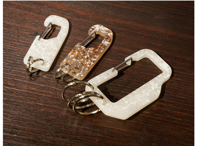
※ アクリルカラビナ (裏)