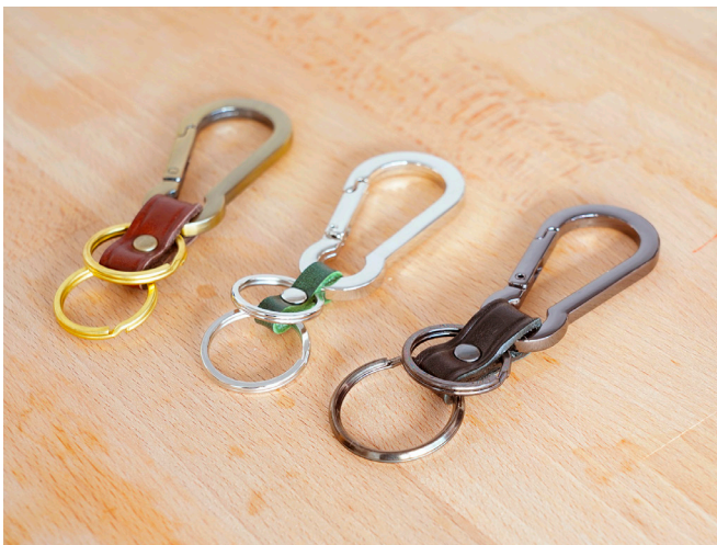
※ キャストカラビナ皮付きホルダー -3