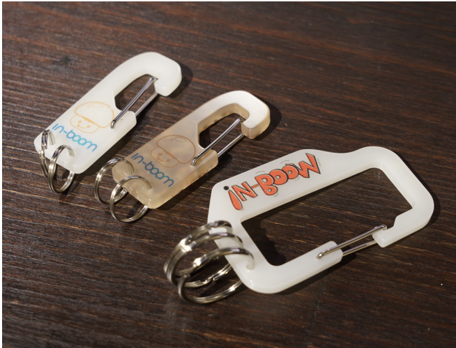
※ アクリルカラビナ (表)