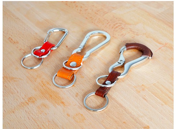
※ キャストカラビナ皮付きホルダー -2