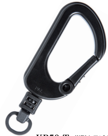
KB50-T 樹脂カラビナ (JP-2+KH-R)