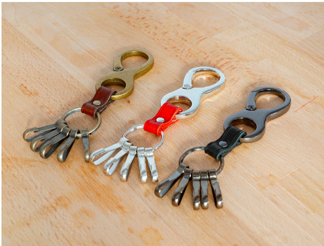
※ キャストカラビナ皮付きホルダー -1