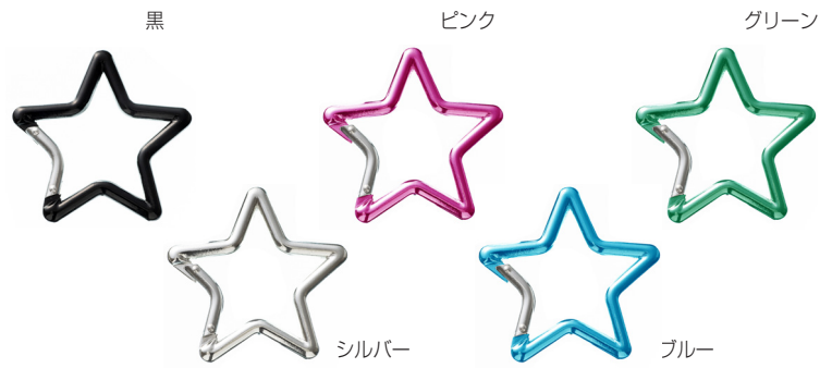
アルミカラビナ アルミ 星