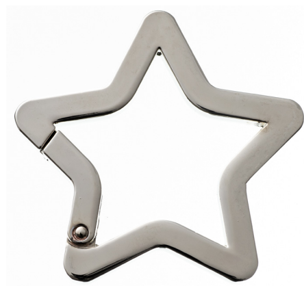
No.135 キャストカラビナ 星 (バフ磨き) 58mm