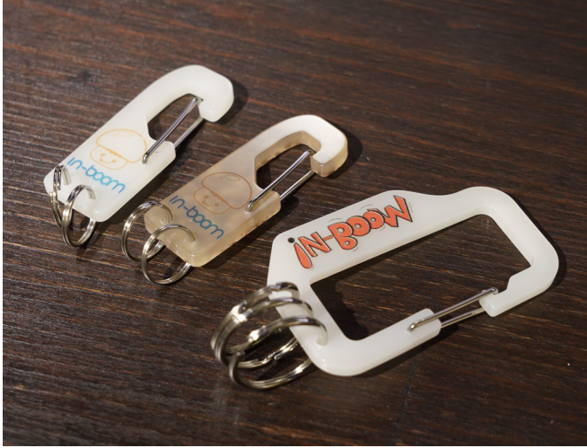
※ アクリルカラビナ (表)