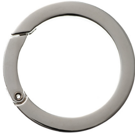
No.133 キャストカラビナ 丸 (バフ磨き) 35mm