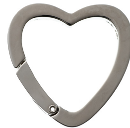
No.134 キャストカラビナ ハート (バフ磨き) 34mm