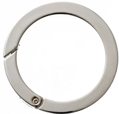
No.133 キャストカラビナ 丸 (バフ磨き) 50mm