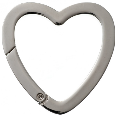
No.134 キャストカラビナ ハート (バフ磨き) 50mm