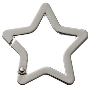
No.135 キャストカラビナ 星 (バフ磨き) 40mm